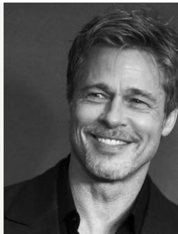
BRAD PITT Né en 1963