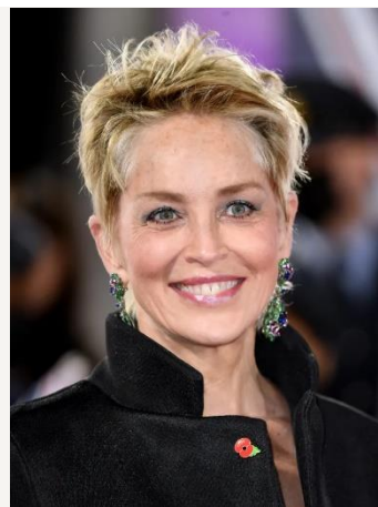
SHARON STONE Née en 1958