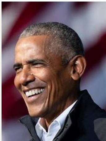
BARACK OBAMA né en 1961