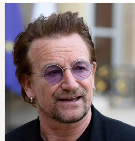
BONO né en 1960