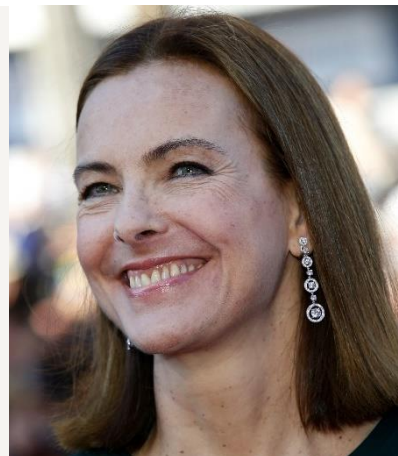
CAROLE BOUQUET née en 1957