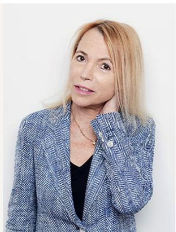
LAURE ADLER née en 1950