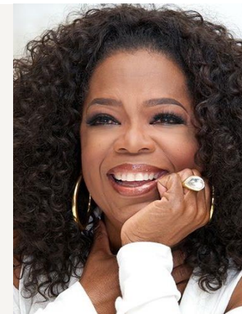
OPRAH WINFREY née en 1954