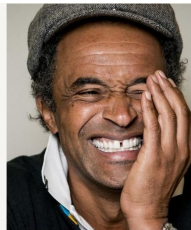
YANNICK NOAH né en 1960