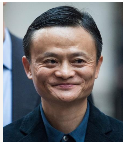
JACK MA né en 1964