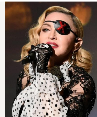
MADONNA née en 1958